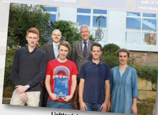
Lichtenfels v Německu