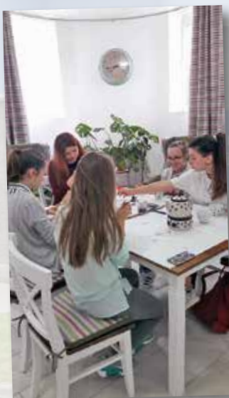
Výuka předmětu Kreativita