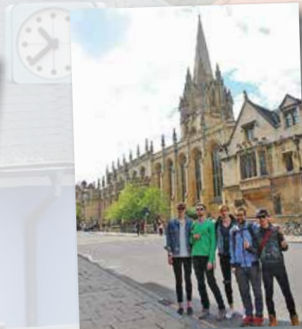
Birmingham v Anglii - poznávání památek