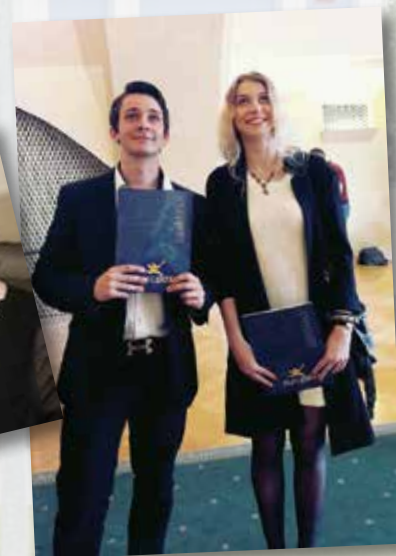
Slavnostní předávání maturitních vysvědčení na Staroměstské radnici