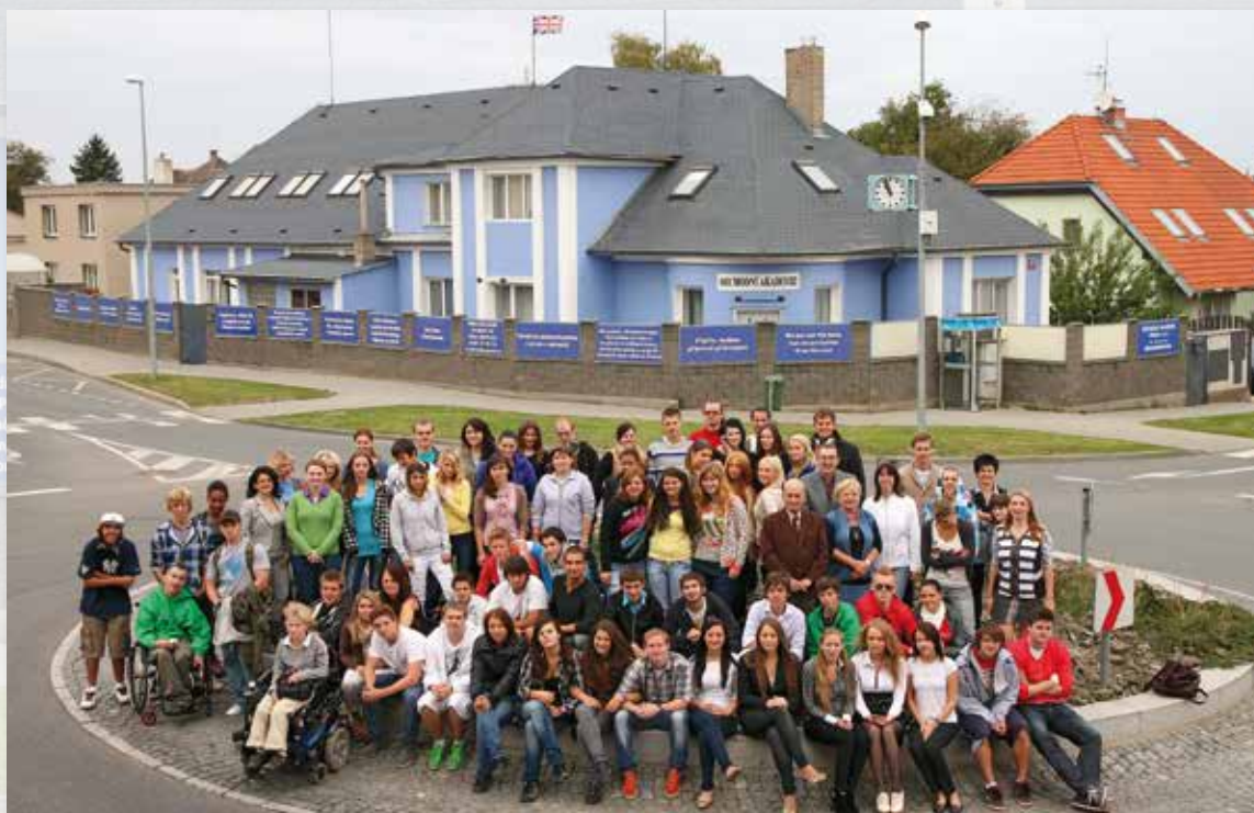
Pohled na budovu školy a studenty