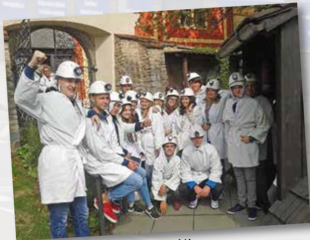
Výlet do Kutné Hory