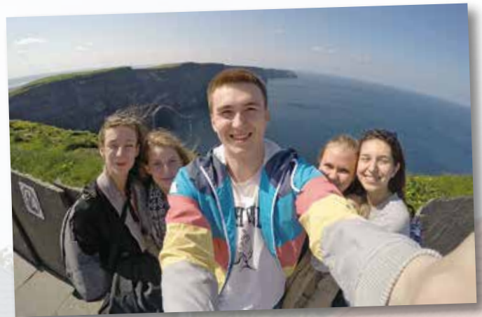
Cork - výlet po Irsku