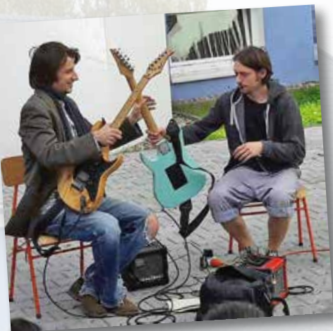
Koncert na školním dvoře