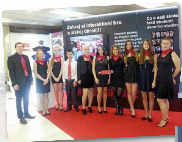
Výstava Schola Praagensis