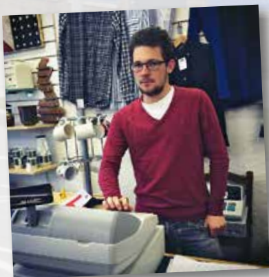
Birmingham v Anglii