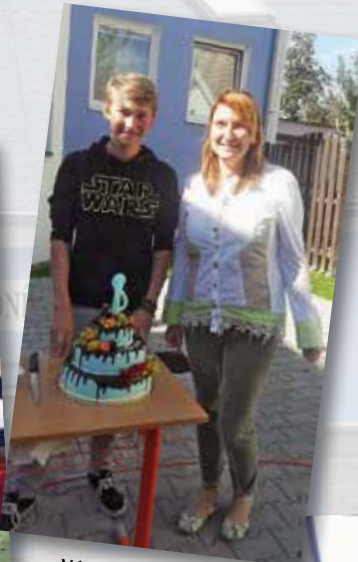
Výměnná stáž Praha - Würzburg