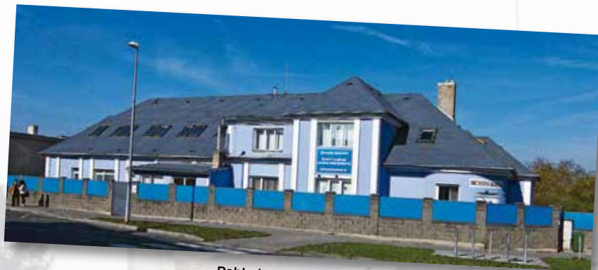
Pohled na vchod do budovy