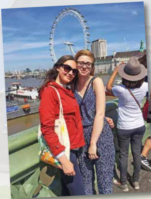
Portsmouth v Anglii - prohlídka města