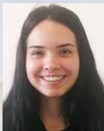
Padron Peňa Pena