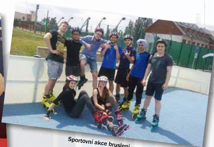
Sportovní akce bruslení