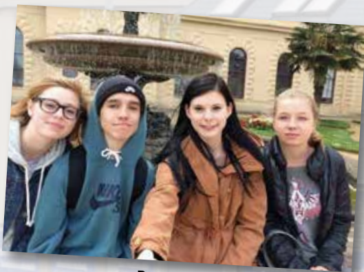
Portsmouth v Anglii

Ubytování a doprava: Ubytování s plnou penzí je zajištěno v rodinách a hrazeno včetně letenky a kapesného z grantu EU. Ubytování může být jednotlivě nebo po dvojicích.