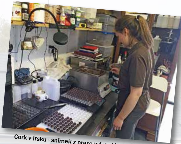
Cork v Irsku - snímek z praxe v čokoládovně