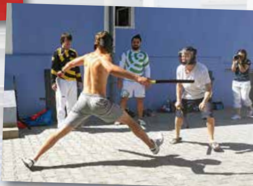
Turnaj v bojovém umění s meči Chunbare