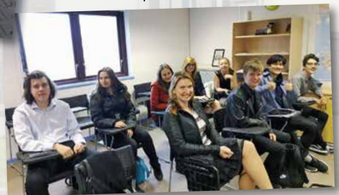
Birmingham - závěrečná ceremonie