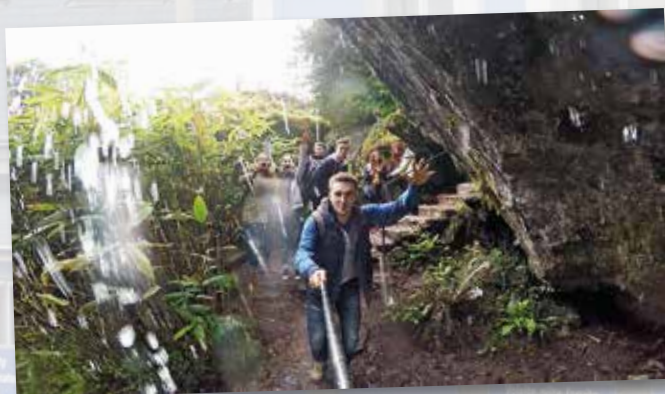
Cork v Irsku