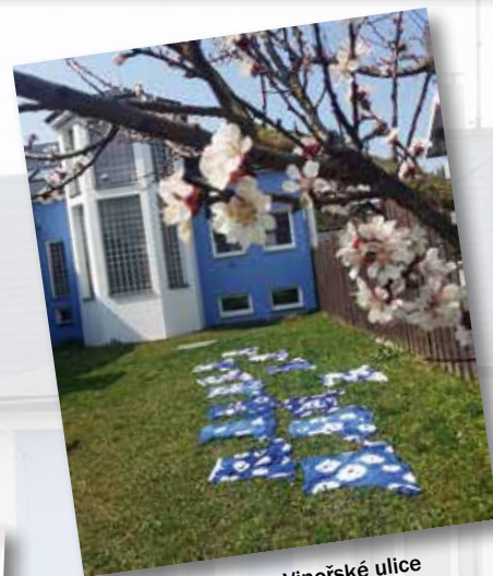
Pohled z Vinořské ulice