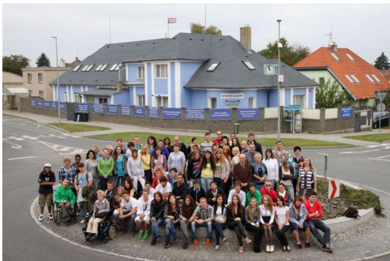
Budova Obchodní akademie Praha, s. r. o., Vinořská 163, Praha 9 – Satalice.